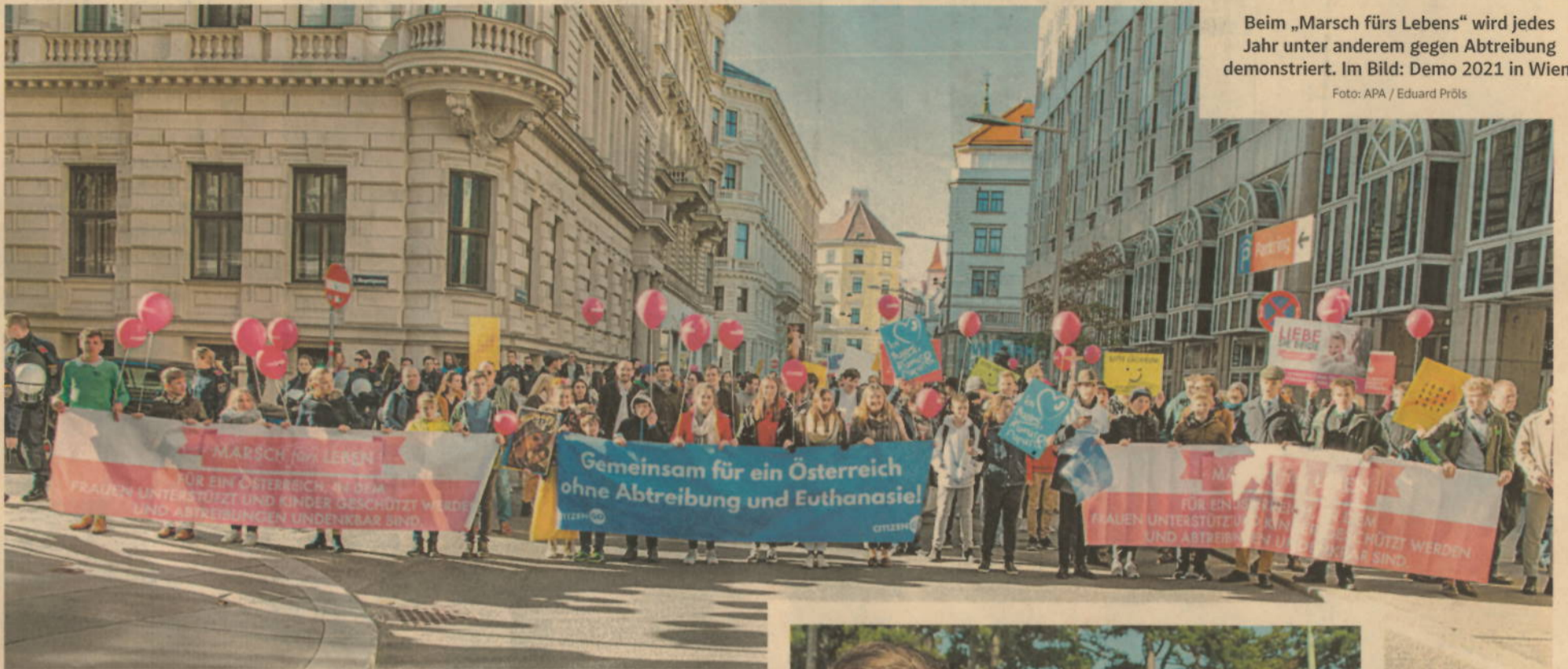
Beim „Marsch fürs Lebens“ wird jedes Jahr unter anderem gegen Abtreibung demonstriert. Im Bild: Demo 2021 in Wien.

gingen im Wiener Jugendparlament aus 250 Ideen hervor, sie werden mit einer Million Euro umgesetzt; darunter etwa ein Motorikpark und Obstbäume.